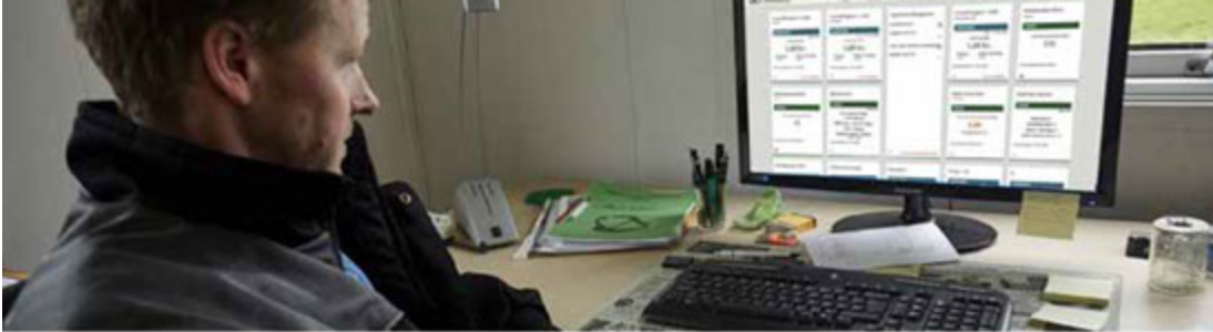
Ambitionen med dashboardet er, at det skal være et business intelligence-værktøj, der kobler den viden, du som landmand har brug for til at styre din bedrift bedst muligt. (Fotomontage)